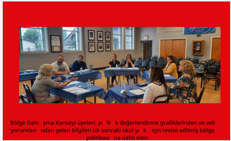
Bölge Danışma Konseyi üyeleri, yıllık değerlendirme grafiklerinden ve veli yorumlarından gelen bilgileri bir sonraki okul yılı için revize edilmiş bölge politikasına dahil eder.

2022-23 öğretim yılı için aile katılım politikası olan ESSA kapsamı içinde geliştirilen Başlık I, Kısmı A için bu bölge ebeveynleri ve aile sistem planını geliştirmek için öneriler ve fikirler. Bölgenin ebeveynleri ve aileleri bu toplantı ve katılan çocuklar hakkında bilgilendirilen ebeveynleri ve aileleri tatmin edici bulmadıkça, okul bölgesi, okul web siteleri de planla birlikte bölge ve okul ebeveyni ve aile yorumları hakkında yayımlanan herhangi bir giriş duyurusunu sunacaktır. Her Başlık I okul bölgesi planı Eyalet Bakanlığımıza sunar ve bölge Eğitimini gözden geçirmek için Ebeveyn Danışma Konseyini (PAC) kullanır. Her ilke böyle bir girdi ister. Sistem ebeveyn ve aile katılımı kapak sayfasına sahiptir. Okul yılı ve girdi isteyen mevcut